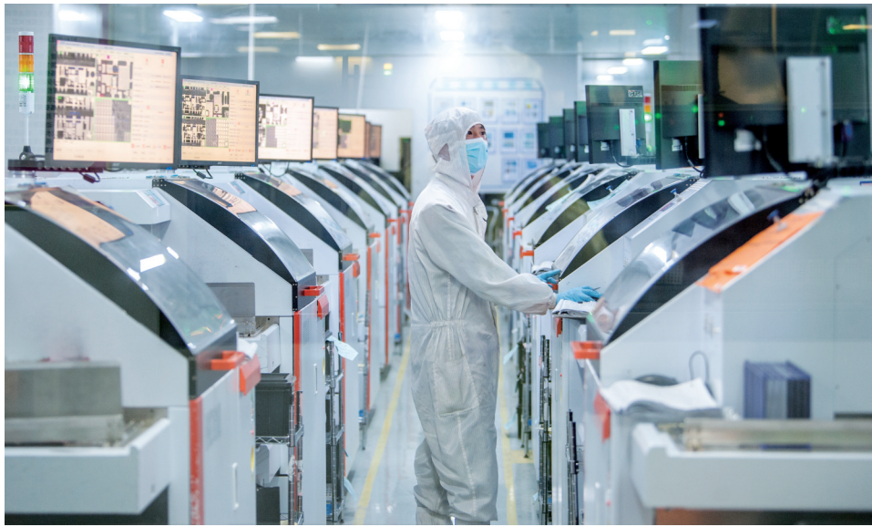
曲阜市坚持一手抓疫情防控,一手抓复工复产,两手抓、两手硬,组建4个复工复产专班,因企施策,精准引导企业有序复工复产。目前,该市185家规模以上企业已全部复工,规下企业也逐步复工。图为在山东晶导微电子股份有限公司,工人正加班加点生产。