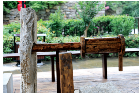
处处风景处处故事