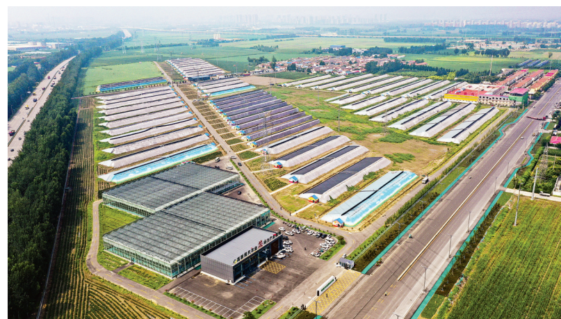
高新现代农业“芯”动力产业基地