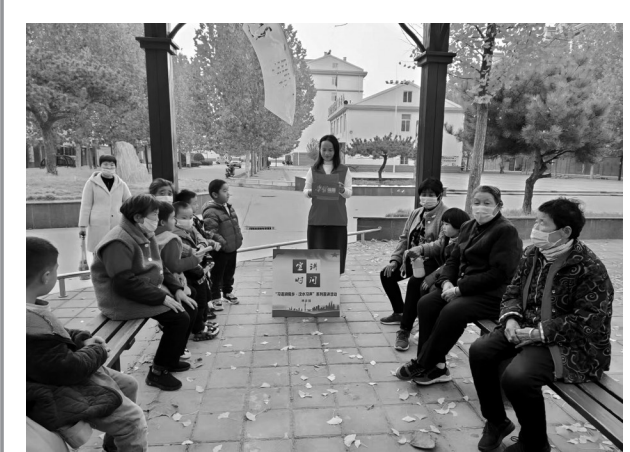
近日,汶上县杨店镇把基层理论宣讲与“学习强国”学习平台宣传推广相结合,开展学习强国流动式宣讲活动。此次宣讲活动不仅提高了“学习强国”学习平台的知晓率和使用率,同时实现了线上线下同频共振,营造了浓厚的学习氛围,让“学习强国”学习平台成为广大党员和群众“指尖上的百科全书”。