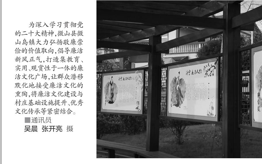
为深入学习贯彻党的二十大精神,微山县微山县岛镇大力弘扬清廉崇俭的价值取向,倡导廉洁新风正气,打造集教育、实用、观赏性于一体的廉洁文化广场,让群众潜移默化地接受廉洁文化的熏陶,将廉洁文化建设与村庄基础设施提升、优秀传统文化传承等紧密结合。