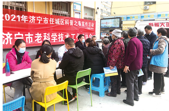
义诊、科普宣传进社区