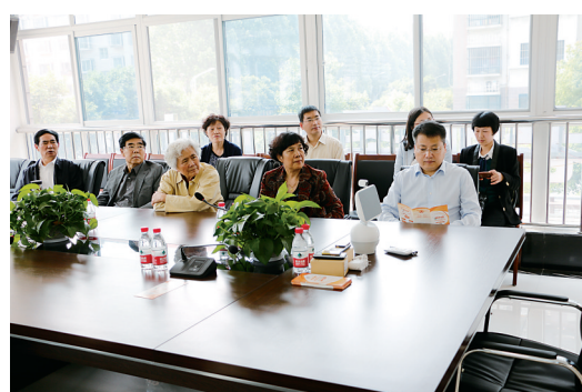
开展医养结合调研