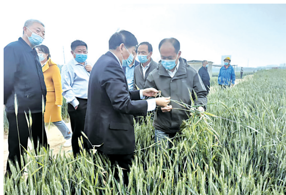
开展助力乡村振兴服务