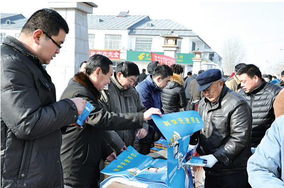
组织开展“三下乡”活动

市老科协两次被省委、省政府授予“全省离退休干部先进集体”荣誉称号；两个周期通过市级4A级社会组织评估；2017年被评为全省老科协工作先进集体、全市社会组织先进团体；2018年被评为全国老科协工作先进集体；2019年市老科协党支部被评为全市先进基层党组织；2021年市老科协被评为全市学会工作先进集体、全省老科协助力企业技术创新行动先进集体；2022年被评为省老科协(2017-2022)先进集体。