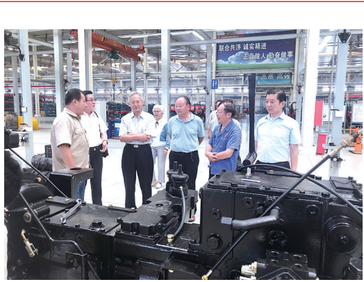
助力企业技术创新