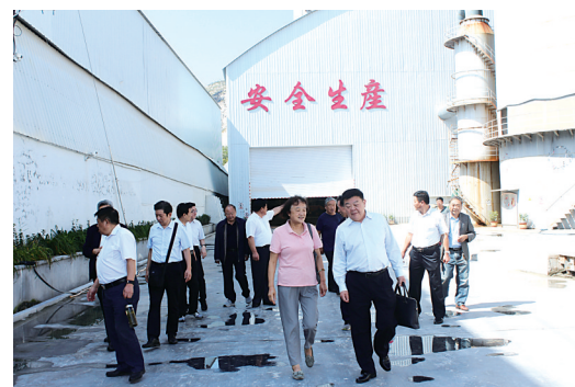
开展资金帮扶调研