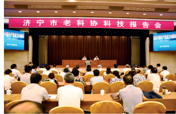
举办科普报告活动