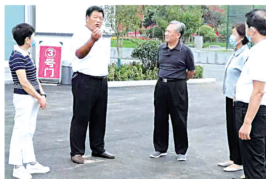
指导基层组织建设