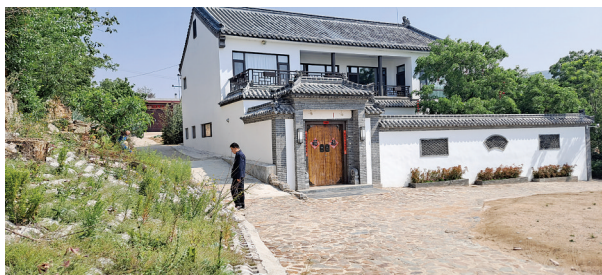
焕然一新的农家小院