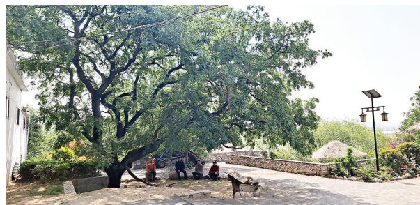
百年皂角树下拉家常