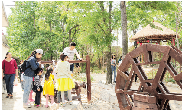
游客在石鼓墩游玩