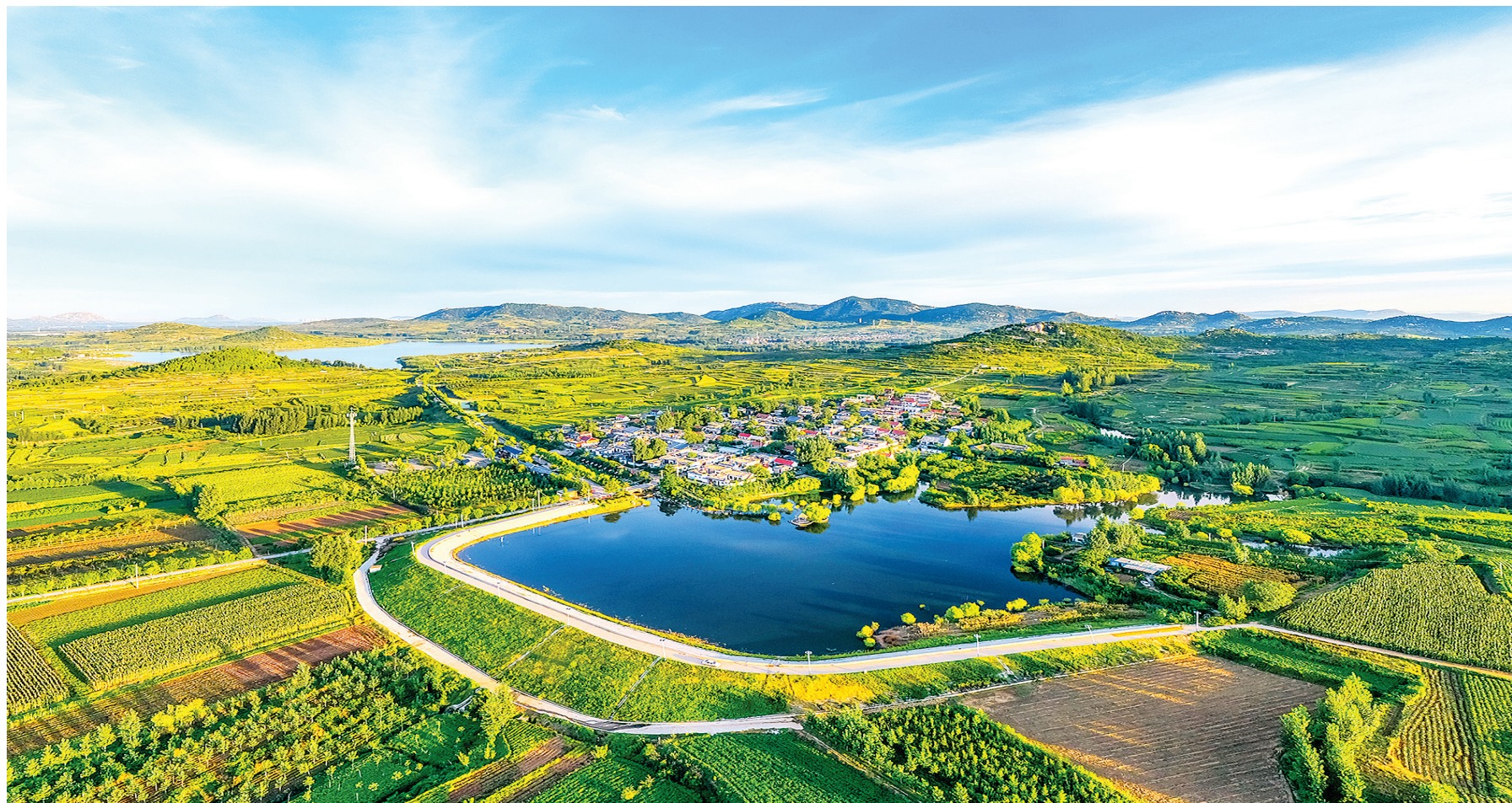
香城镇石鼓墩村鸟瞰图