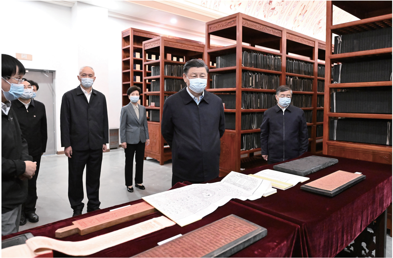
6月2日,中共中央总书记、国家主席、中央军委主席习近平在北京出席文化传承发展座谈会并发表重要讲话。这是座谈会前,习近平1日下午在中国国家版本馆考察时,在兰台洞库了解馆藏精品版本保存情况。

新华社北京6月2日电 中共中央总书记、国家主席、中央军委主席习近平6月2日在北京出席文化传承发展座谈会并发表重要讲话。他强调,在新的起点上继续推动文化繁荣、建设文化强国、建设中华民族现代文明,是我们在新时代新的文化使命。要坚定文化自信、担当使命、奋发有为,共同努力创造属于我们这个时代的新文化,建设中华民族现代文明。