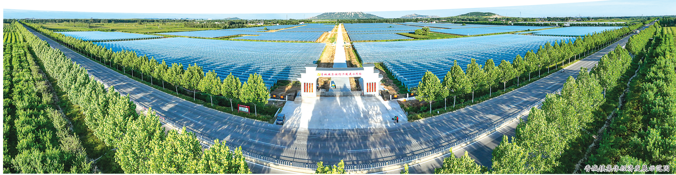
香城镇集体经济发展示范园