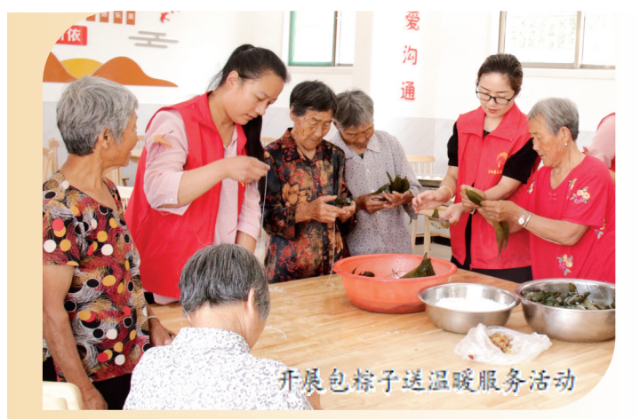
开展包粽子送温暖服务活动

坚持以人民为中心的发展理念，尽心竭力解民忧、纾民困、惠民生、暖民心。创新“香城问事人”服务机制。坚持干字当头、实字为先，推行“网格化+民情走访”治理模式，成立100支党员志愿服务队和66支党员突击队，全镇530余名镇村干部、志愿者化身群众的“问事人”，协助村级调解邻里纠纷、家庭矛盾40余次，收集并解决农田灌溉、闲置资源盘活等各类问题236件，争取库区移民资金300余万元用于提升村级基础设施，群众幸福感、满意度持续提升。香城镇《推动“问事人”服务群众机制显效见长效》被《中国社区报》刊发报道。社会事业蓬勃发展。进一步营造尊师重教的浓厚氛围，连续多年表彰优秀教师工作者、教子有方好家长，累计发放奖学金200余万元，今年高考，该镇本科上线26人次，中考上线155人次。医疗卫生事业稳步向前，完成韩岭村、大山阴村、茶沟村3处村级卫生室建设，香城镇卫生院与济宁市中医院康复分院成立名医工作室，香城镇卫生院入选济宁市中医药健康文化知识角建设单位名单。“如康家园”帮助40余名残疾人实现就业，缓解劳动者“就业难”问题。就业驿站发展模式，入围山东省16市“高质量充分就业省份”揭榜领题标志性项目。基础设施提档升级。全力推进农村供水一体化和污水治理提升工程，完成全部村庄供水改造。投资130余万元，对王庙村、杨桃村等10个村实施田间排涝工程。投资45万元，完成10座公厕改造提升；投资10余万元，率先完成100户农户改厕任务。巩固扩大“四好农村路”建设，延伸实施40公里村级道路维修提升工程，完成太香线大修工程、王马线中修工程、连青山旅游路南延工程、富唐路东延及香石线改建工程，进一步推动该镇路网建设提量升级。临荷路东延、尧王线、香莫线等道路，入选山东省2023旅游公共服务典型案例。