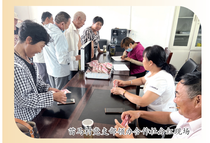
苗马村党支部领办合作社红现场