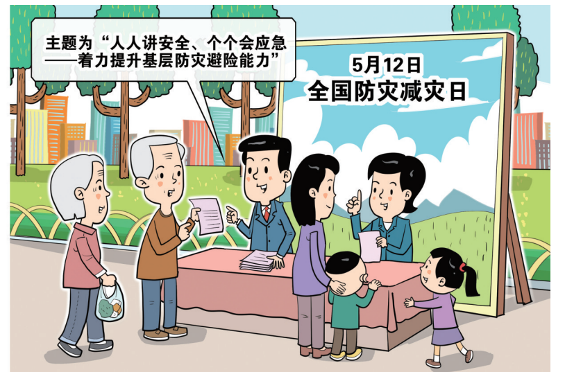
防灾减灾科普宣教活动 新华社发 朱慧卿作

此外，各地各部门注重创新，多措并举开展主题活动，如第八届全国防震减灾科普讲解大赛总决赛在宁波举行，来自各地的科技、安全类场馆解说员、学校老师、大学生等众多选手参与；安徽举办全国防灾减灾日主题短视频大赛；中国公共关系协会、中国灾害防御协会、中国应急管理学会联合举办“防灾减灾：从基层做起”论坛等，系列活动有效调动了各方参与积极性。