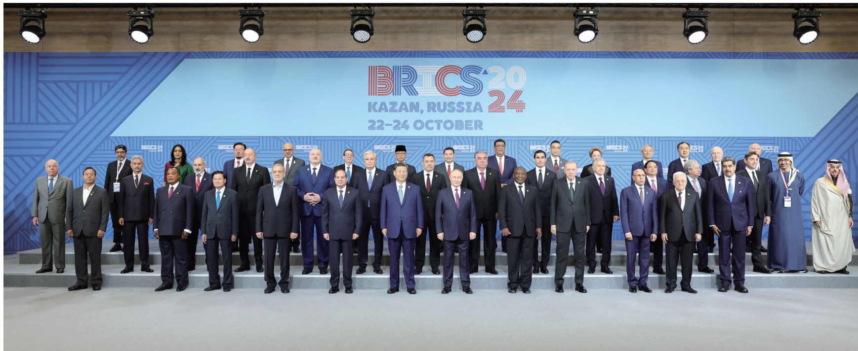
当地时间10月24日上午,国家主席习近平在喀山会展中心出席“金砖+”领导人对话会并发表题为《汇聚“全球南方”磅礴力量 共同推动构建人类命运共同体》的重要讲话。这是出席对话会的金砖国家及嘉宾国领导人或代表、国际组织负责人集体合影。