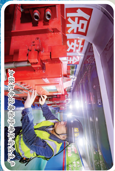
加强机电设备检修保障安全生产