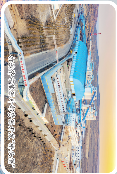
打造济宁能源外部资源开发“桥头堡”