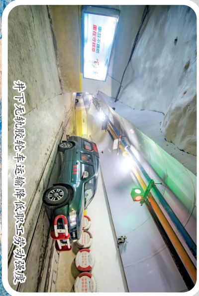
井下无人值守矿车运输降低职工劳动强度