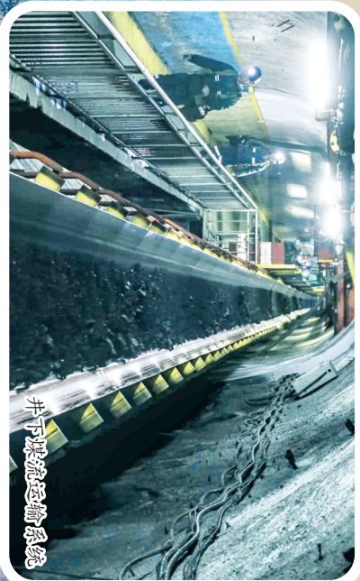
井下无人值守系统