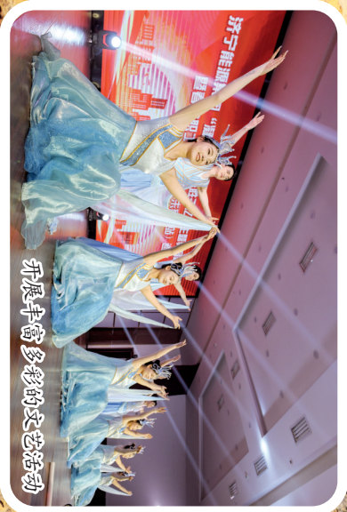
朱家峁丰富职工文体生活