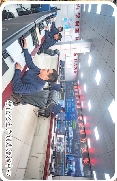
智能化生产调度指挥中心