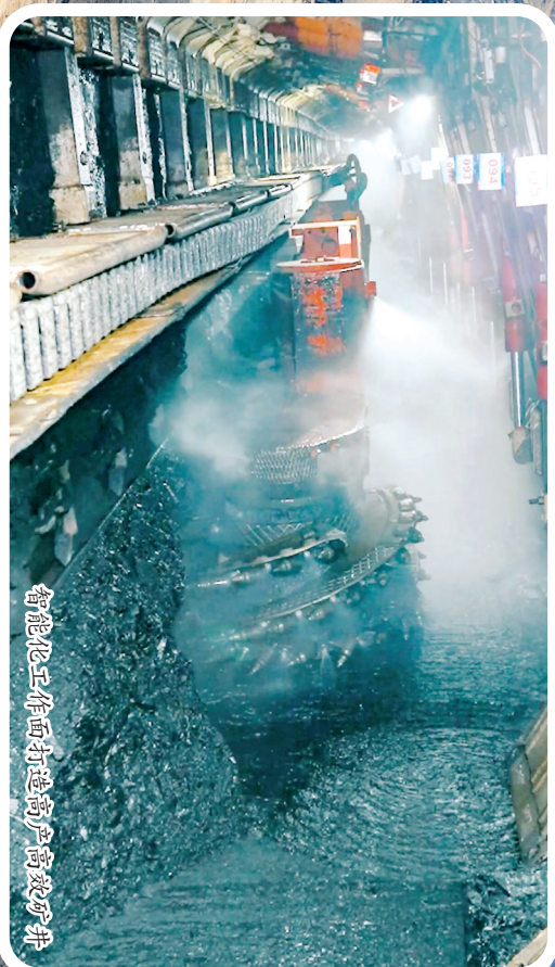
智能化工作面打造高产高效矿井