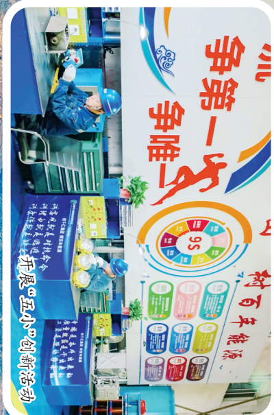
“争第一、争唯一” 开展“五小”创新活动