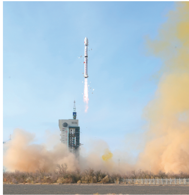
12月9日11时41分，我国在酒泉卫星发射中心使用长征四号乙运载火箭，成功将遥感四十七号卫星发射升空，卫星顺利进入预定轨道，发射任务获得圆满成功。