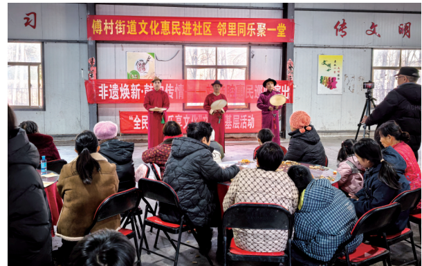
微山县傅村街道在运河社区举办“文化惠民进社区 邻里同乐聚一堂”主题活动,为辖区居民献上一场丰富多彩的文化盛宴,营造和谐温馨的社区氛围。

“我们将继续深化产业链党建,推动产业向更高质量发展迈进。”产业链党委负责人表示。在党建“红帆”引领下,鱼台高端盐化工产业链正稳步前行,为县域经济高质量发展注入源源不断的红色力量。