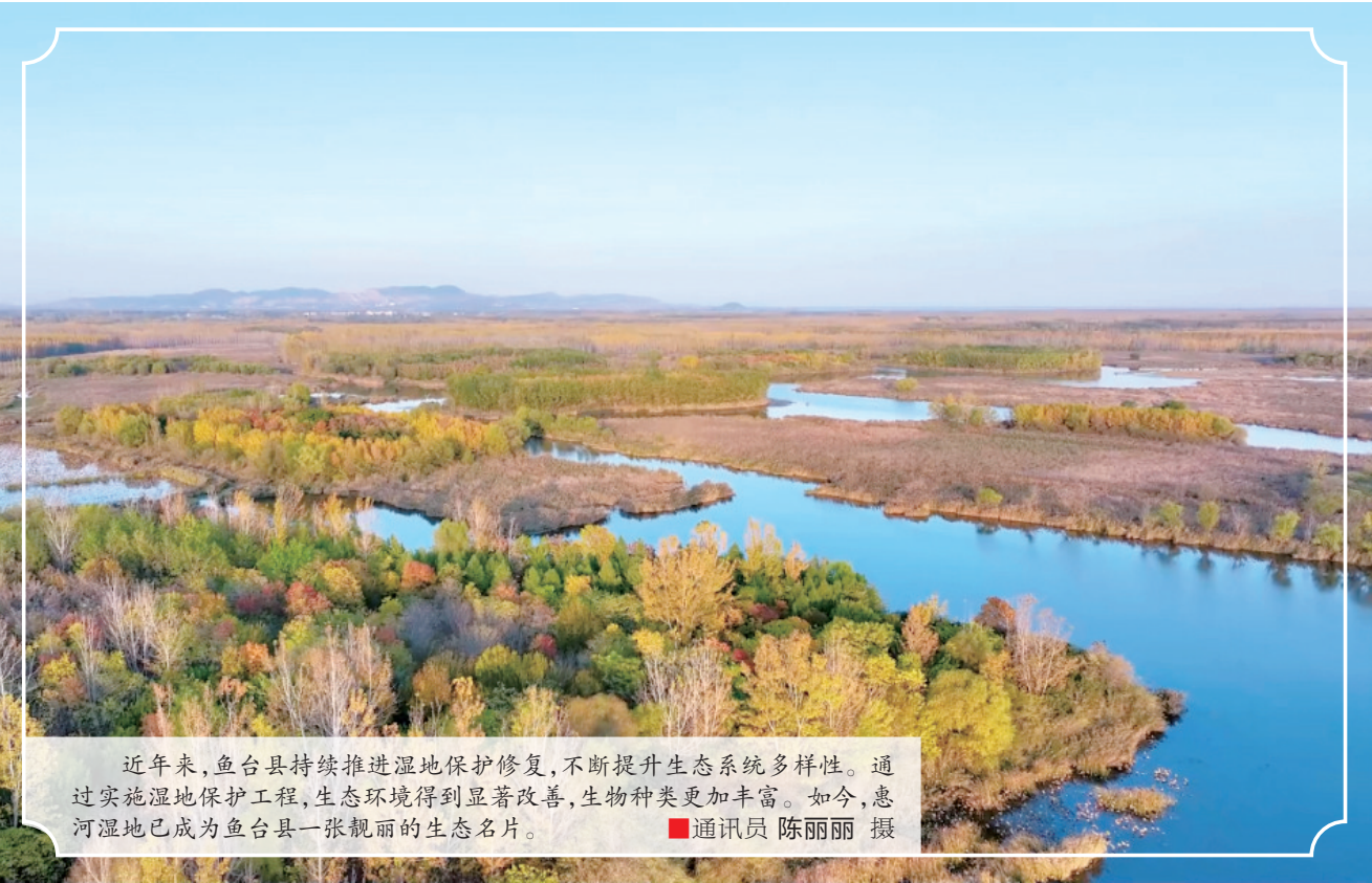
近年来,鱼台县持续推进湿地保护修复,不断提升生态系统多样性。通过实施湿地保护工程,生态环境得到显著改善,生物种类更加丰富。如今,惠河湿地已成为鱼台县一张靓丽的生态名片。

活动现场,工作人员热情地忙碌着,把一份份水饺送到环卫工人手中的同时,还叮嘱大家做好防寒保暖,注意身体健康。拿到水饺的环卫工人笑容满面,纷纷对工会的关怀表示感谢。“天气虽然冷,但心里特别暖,感谢工会的惦记!”一位环卫工人捧着水饺激动地说。