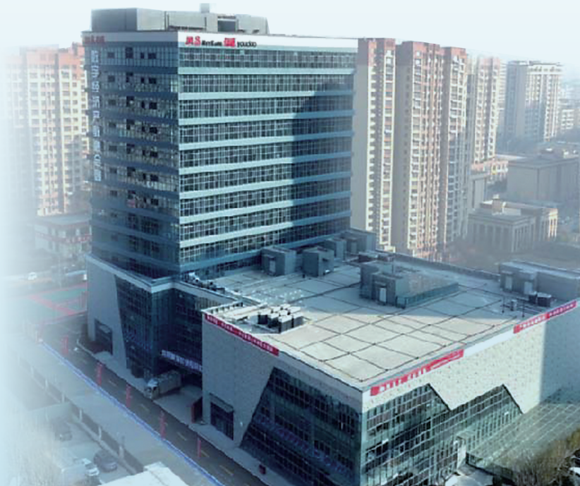
网易融发数字内容生产基地