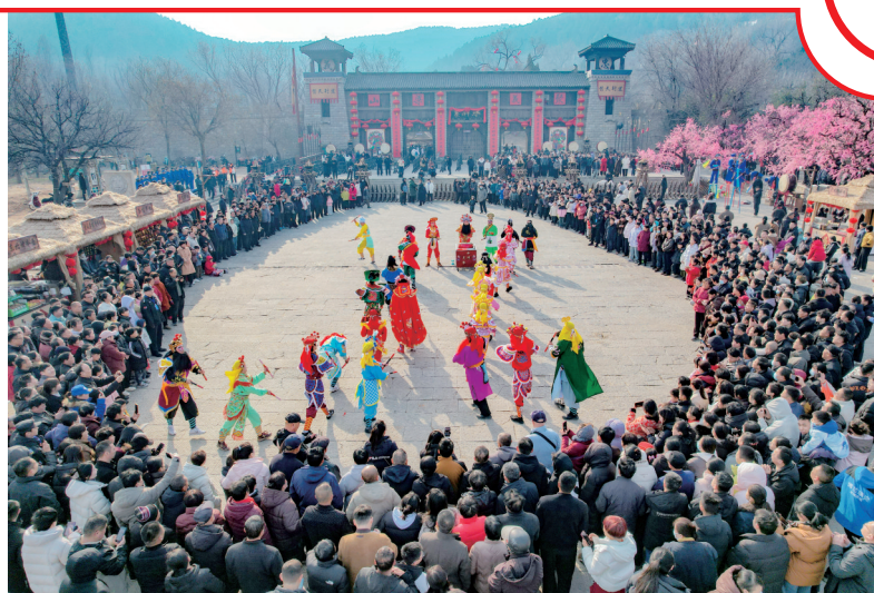
水泊梁山景区大型非遗表演《英歌战舞》