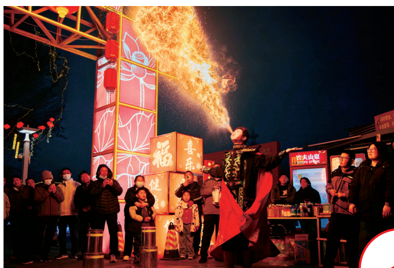
川剧变脸吐火表演