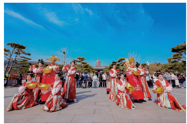
“好运尼山·圣境有戏”新春主题活动