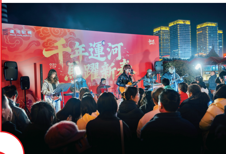
晚风伴乐，灯火映河