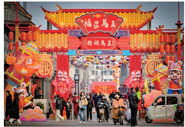
春节消费市场活力迸发