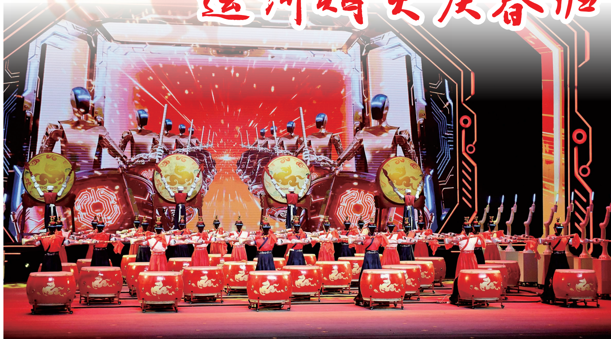
山东省机器人春晚为节日增添了浓浓的喜庆氛围