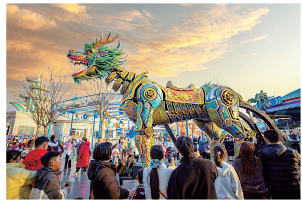
济宁方特巨型机甲麒麟霸气登场