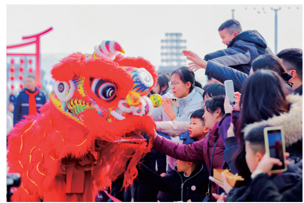
醒狮迎宾，互动十足