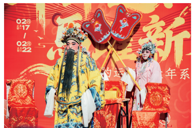
传统戏曲，婉转悠扬