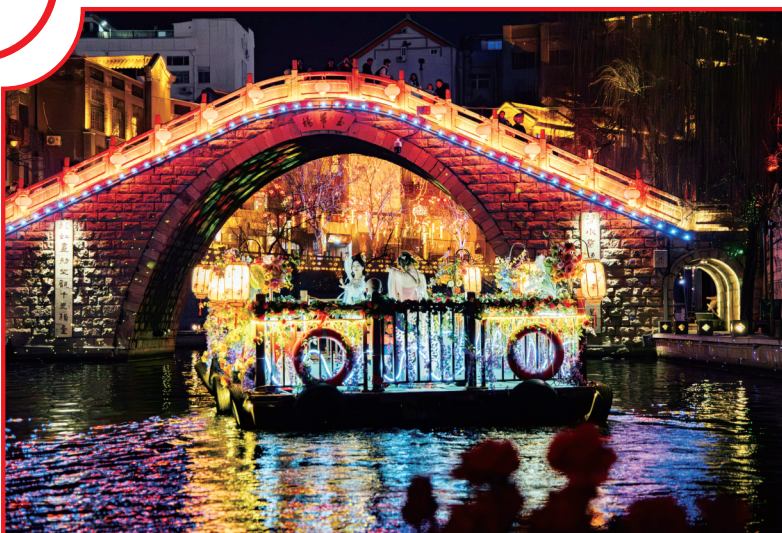
运河之上，花船轻摇

在济宁，年味不仅是挂在天边的烟火，更是握在手里的糖葫芦、听进心里的戏曲，以及那一张张被节日的喜悦映红的脸。相约济宁过大年，约到的是一个热气腾腾的中国年。