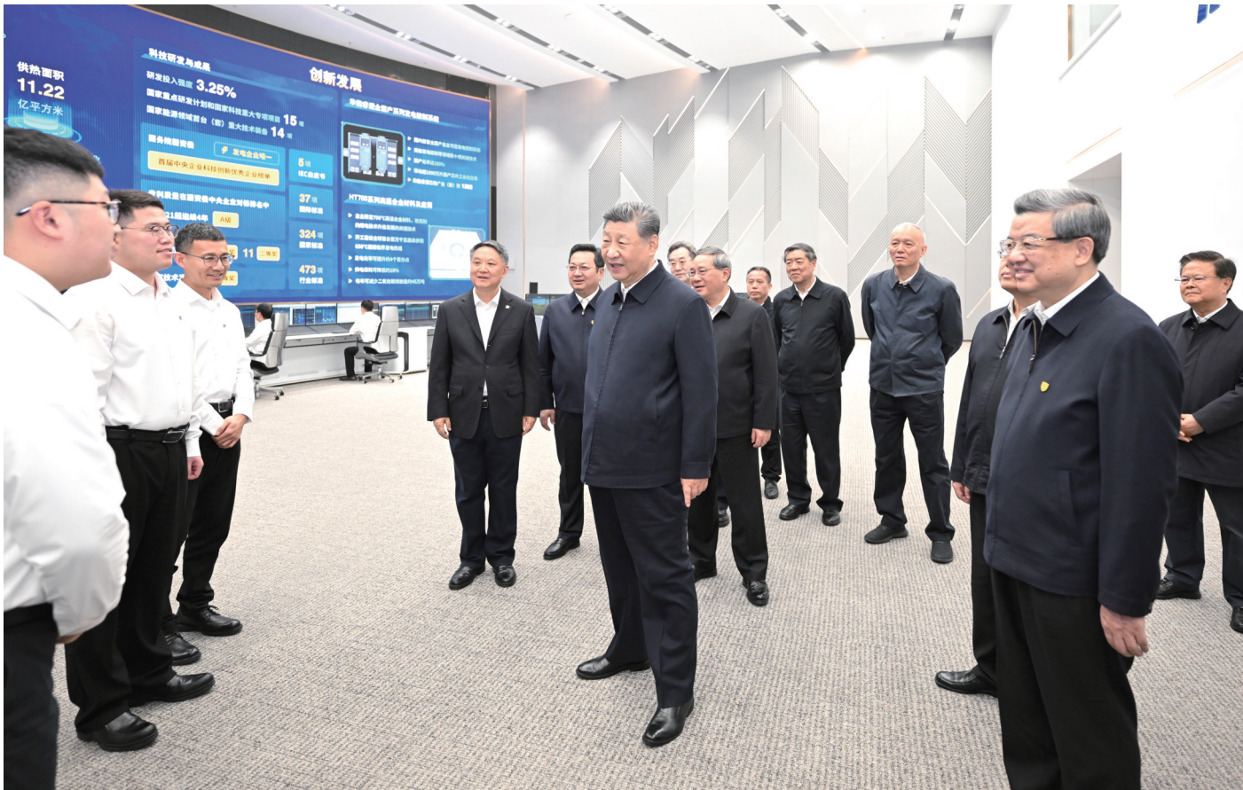
3月23日,中共中央总书记、国家主席、中央军委主席习近平在河北雄安新区考察,并主持召开深入推进雄安新区高质量建设和发展座谈会。这是23日上午,习近平在中国华能集团有限公司考察时,同企业员工亲切交流。

新华社河北雄安新区3月23日电 中共中央总书记、国家主席、中央军委主席习近平23日在河北雄安新区考察,主持召开深入推进雄安新区高质量建设和发展座谈会并发表重要讲话。他强调,要牢牢把握雄安新区作为北京非首都功能疏解集中承载地的首要功能定位,保持战略定力和历史耐心,进一步解放思想、开拓思路、加强协调、凝聚合力,以改革创新为引领,增强内生发展动力,以要素资源合理集聚为重点,激发新区活力,努力建设新时代创新高地和