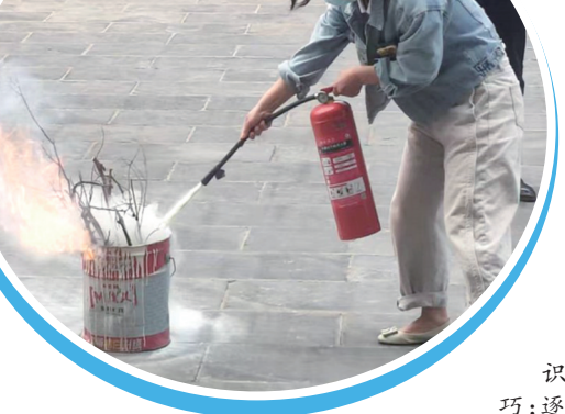
为切实强化全体干部职工消防安全意识,全面提升自救自护能力和突发火灾应急处置水平,近日,济宁市疾病预防控制中心开展了消防安全培训演练活动。