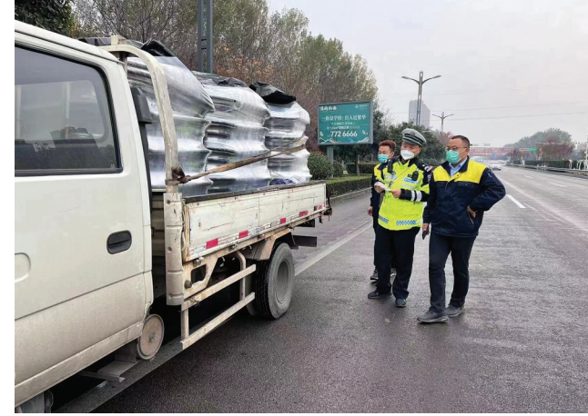
近日,济宁经开区交警大队结合道路交通事故预防“减量控大”工作,加大路面管控,持续打击大货车超限超载、非法改装、闯禁区、非机动车逆行、未按规定佩戴安全头盔等不文明交通违法行为。同时,扎实开展农村三轮车“三见面一建档”交通安全管理工作,与三轮车驾驶人逐一见面,签订安全承诺书、拍摄车辆照片、逐一登记,并建档留存,从而准确掌握三轮车及驾驶人基础信息,切实强化源头管控。

管理模式,推动出资人党员做好“六个表率”,中层管理党员发挥“四个作用”,一线职工党员争做“三个示范”、流动党员服从“四个双向共管”、困难党员接受“三个针对性帮扶”,不断发挥两新组织党员先锋模范作用。利用“灯塔—党建在线”平台,规范使用山东e支部组织生活全程纪实,发展党员纪实公示等功能,党组织、党员信息库数据及时得到更新维护。创新研发“济宁经开区两新组织党员分类管理系统”,进一步提升党员管理的精准化、智能化水平,每月上报党员履职情况、量化积分情况以及工作动态,系统为每位党员单独“赋码”,党员职工通过扫二维码可及时了解党员发挥作用的情况,此经验做法被评为山东省2022年新型智慧城市“智慧党建”优秀案例。