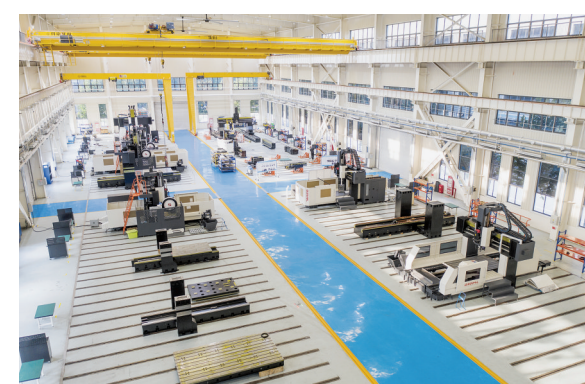
山东微晶高端数控机床智能智造项目