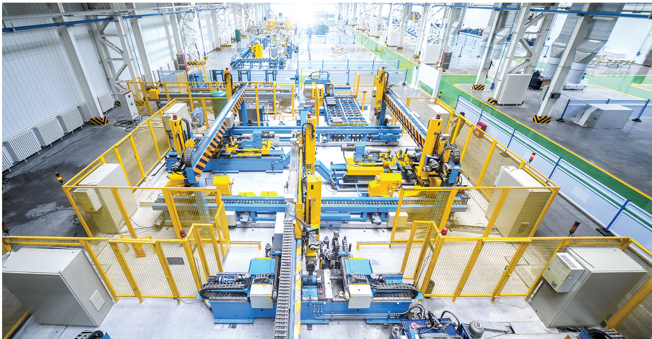
充矿能源智慧制造一期项目