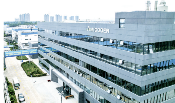
艾美科新建30吨泰拉霉素产业化项目