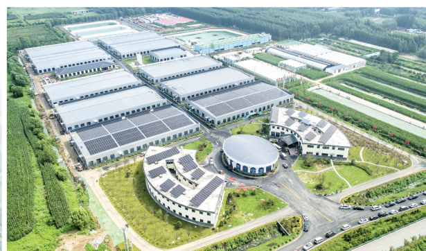
微山湖超级渔仓项目