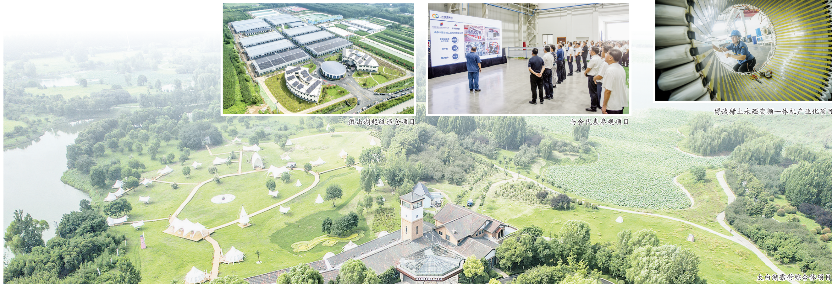
太白湖露营综合体项目