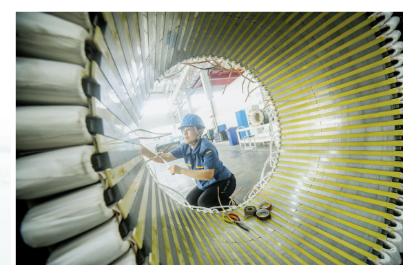
博诚稀土永磁变频一体机产业化项目