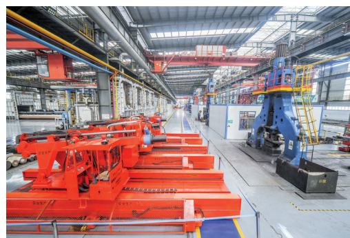
伊莱特高端制造新材料项目