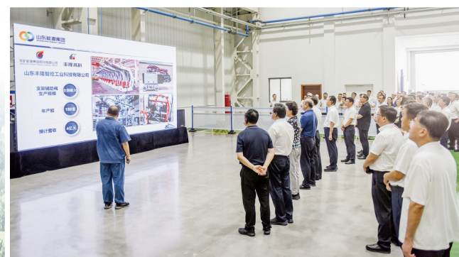
与会代表参观项目