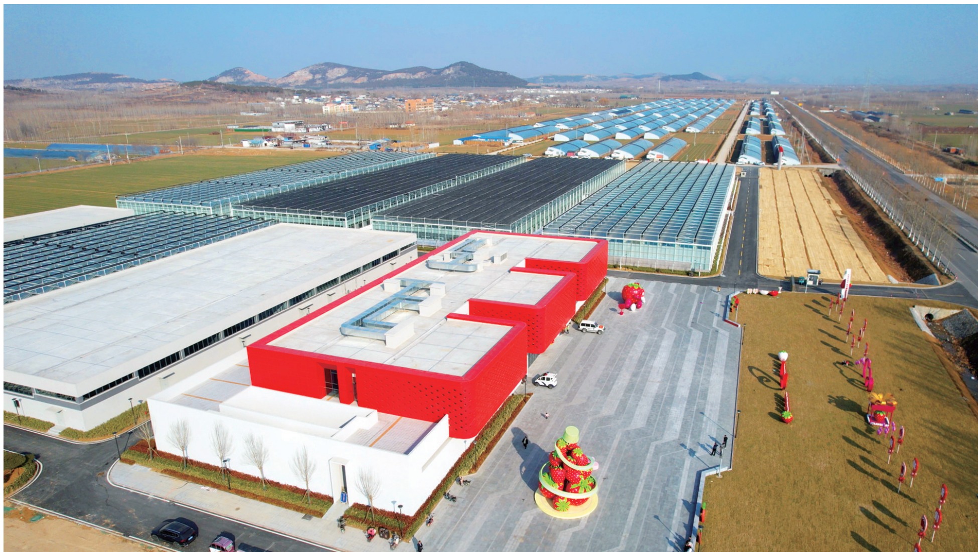
俯瞰草莓种植园示范片区