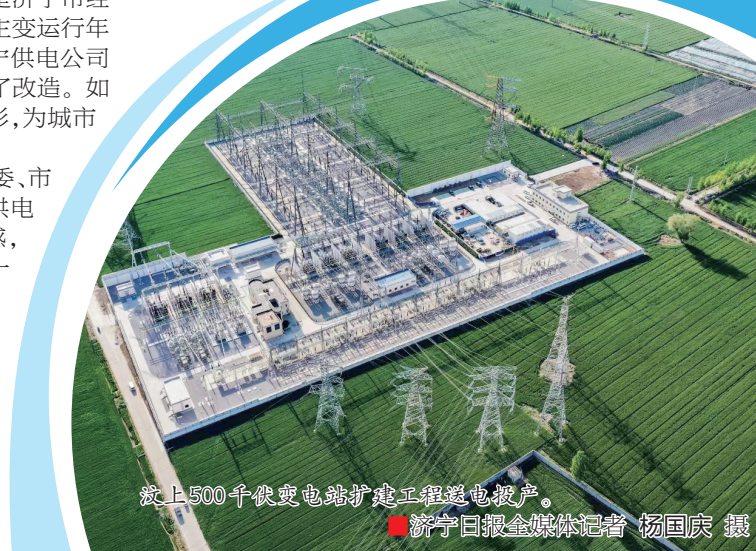
汶上500千伏变电站扩建工程送电投产。