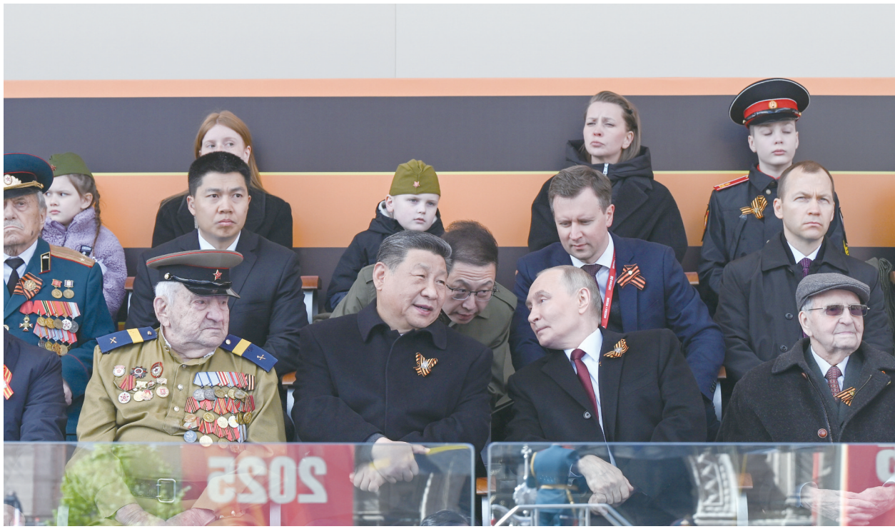
当地时间5月9日,俄罗斯举行盛大庆典,纪念苏联伟大卫国战争胜利80周年。国家主席习近平和来自世界20多个国家及国际组织领导人应邀出席庆典。