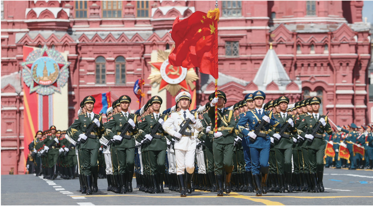
5月9日,在俄罗斯首都莫斯科,中国人民解放军三军仪仗队方队参加纪念苏联伟大卫国战争胜利80周年阅兵式。